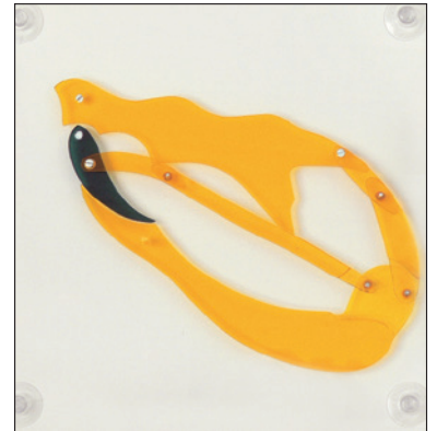
550.105 Giftschlangenschädel. Funktionsmechanismus des Schlangengammas beim Öffnen und beim Aufstellen der Giftzähne (4 Gelenk-Kette).