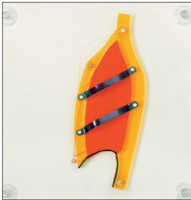
550.100 Rippen- und Zwerchfellatmung. Dargestellt an 3 möglichen Atmungsvorgängen.

Plexiglas-Grundplatte mit Saugnäpfen zum Haften, 20x20cm.