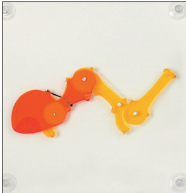
550.103 Katzenkrallen, bei gebeugter Hand: Krallen eingezogen, bei gestreckter Hand: Krallen aus Hautfalte herausgestreckt.