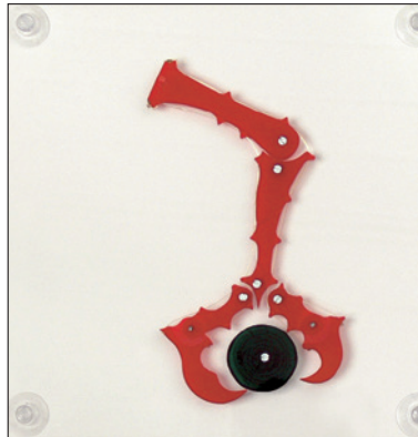
550.104 Der Vogelfuß, die automatische Bewegungsfunktion der Vogellauf-Zehen z.B. An- und Abflug, Festhalten am Ast, Beutefang.